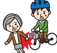
自転車にぶつけられ、ケガをした