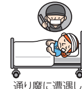
通り魔に遭遇し 重度後遺障害を被る