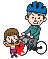
自転車で他人に ケガを負わせた