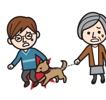
飼い犬が他人に かみついて ケガを負わせた