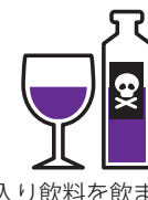
毒入り飲料を飲まされ 重度後遺障害を被る

被保険者の職業によって、ご加入いただける「型」が異なります。ご職業と型の関係は職種級別表(7頁)のとおりとなります。