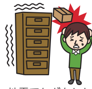
地震でケガをした